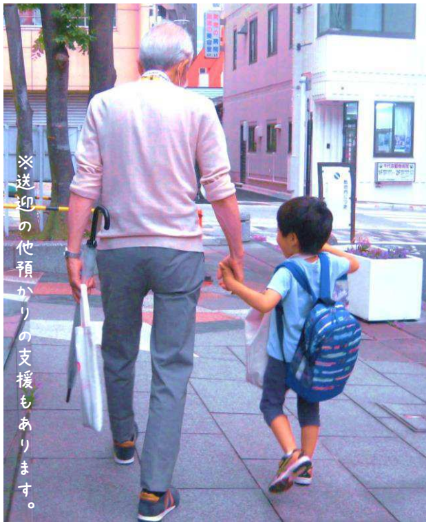
※送迎の他預かりの支援もあります。